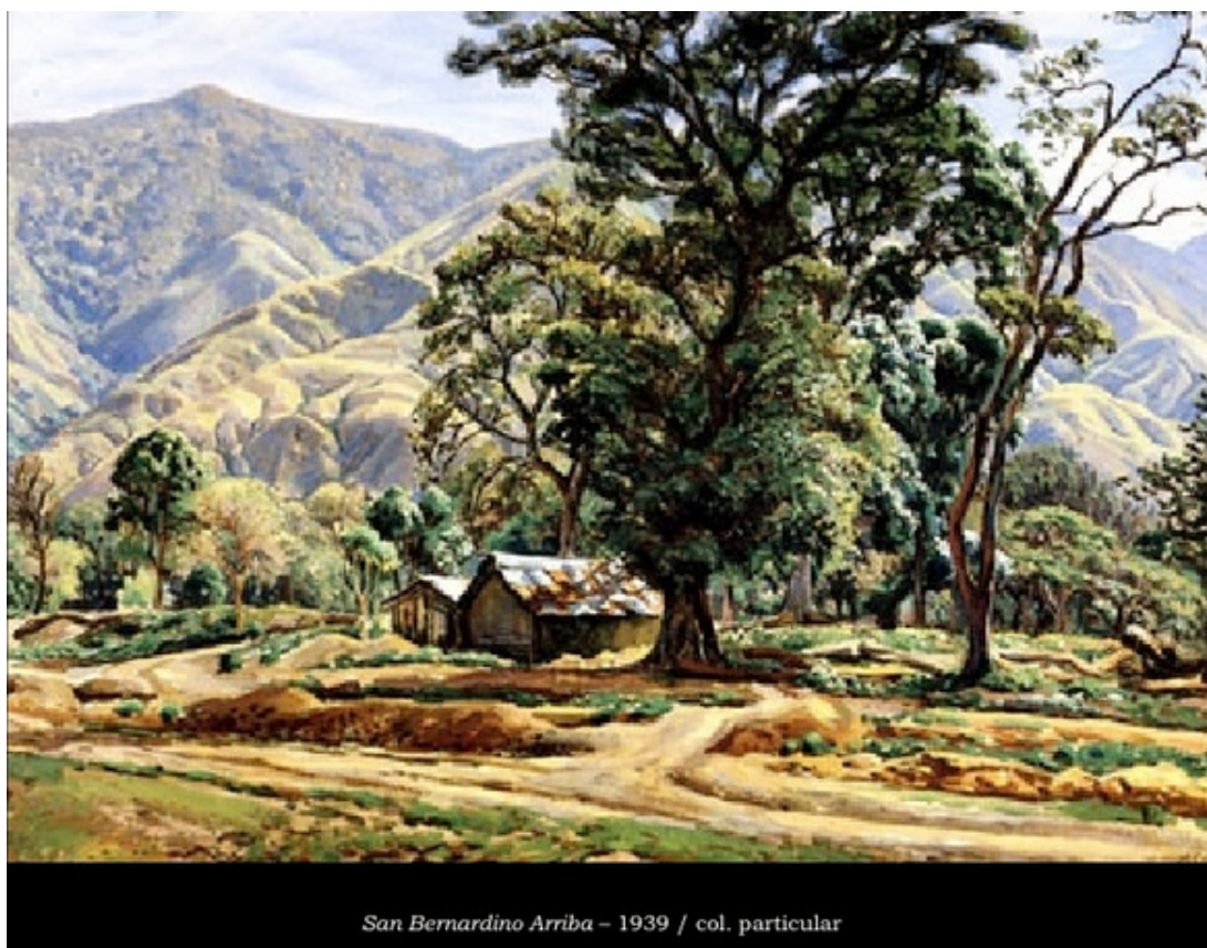
Pintura de Manuel Cabré, el pintor del Ávila.

“La única casa de campo a la que se le podía llamar “Quinta” apropiadamente, fue la del finado Marqués del Toro, situada a orillas del río Anauco en la raíz de la sierra”. (Lisboa en Blondet, 2006, p: 6 y 7). Referencia a la Quinta Anauco hecha por el diplomático Miguel María Lisboa en 1853 ante su posible ocupación en calidad de inquilino.