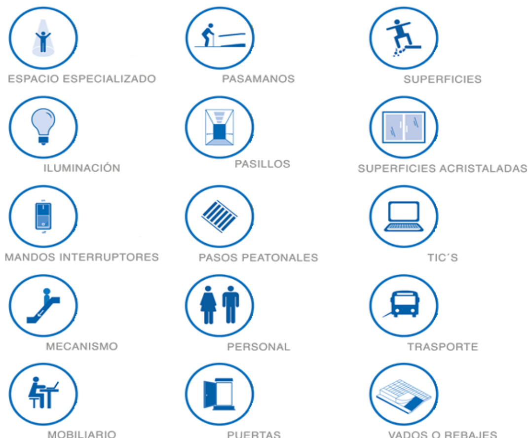
Figura 1: Unidades de observación